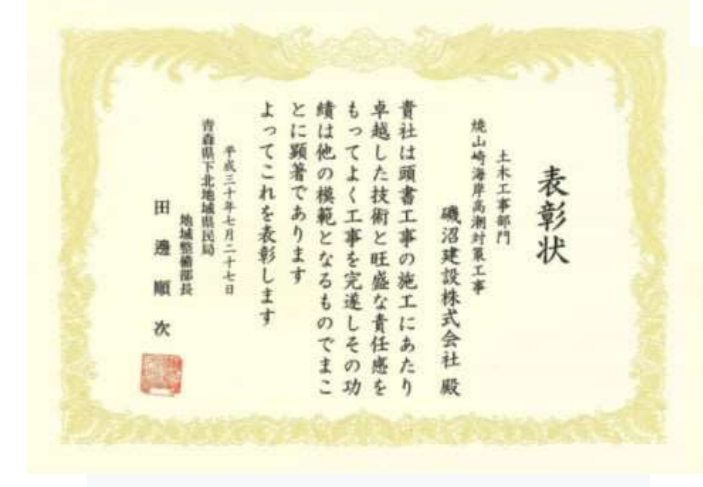
・H30焼山崎海岸高潮対策工事 青森県下北地域県民局地域整備部長表彰