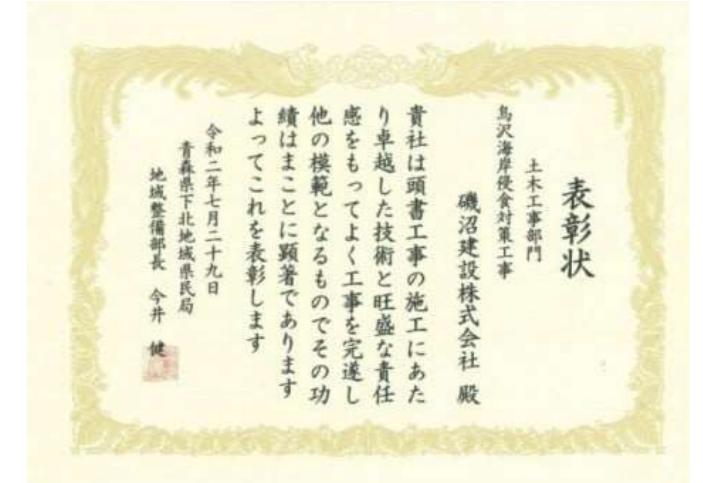
・R2烏沢海岸侵食対策工事 青森県下北地域県民局地域整備部長表彰