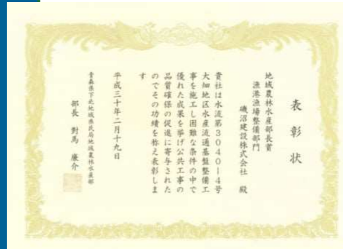
・H30大畑地区水産生産基盤整備工事 青森県下北地域県民局地域農林水産部部長表彰