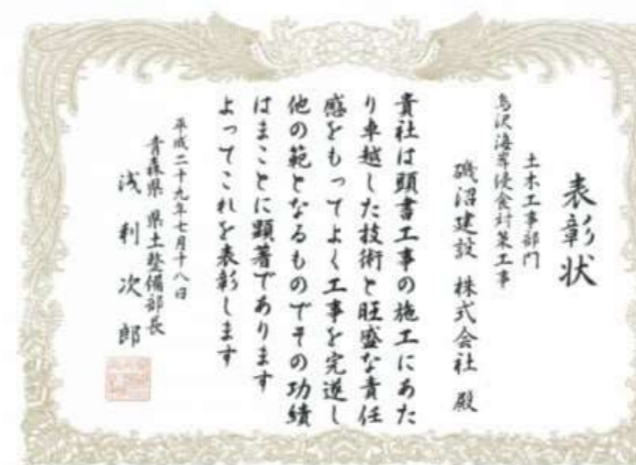
・H29烏沢海岸侵食対策工事 青森県県土整備部長表彰