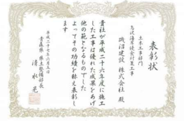
・H27烏沢海岸侵食対策工事 青森県県土整備部長表彰